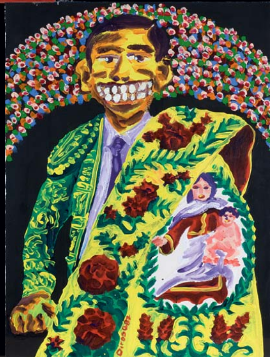
Hervé Di Rosa